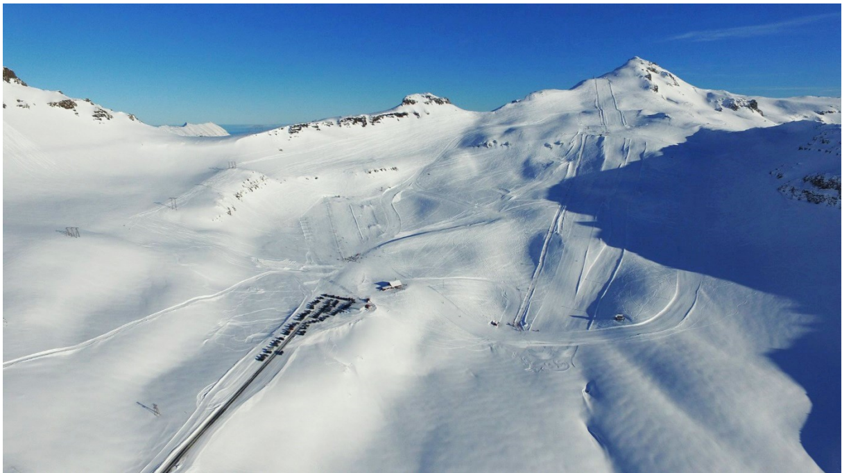
MYND 2.1 Yfirlitsmynd af svæðinu að vetri til.

Skipulagssvæði skíðasvæðisins er um 90 ha að stærð í Sellátradal og er fjölsótt skíðasvæði á Austurlandi. Eina aðkoman að skíðasvæðinu er frá Eskifirði og um Oddsskarðsveg (nr. 9549). Fjarlægð frá gatnamótum Strandgötu á Eskifirði og Oddsskarðsvegi (nr. 9549) og að skíðasvæðinu er um 7 km. Skíðasvæðið er staðsett þar sem þjóðvegurinn lá áður fyrir frá Eskifirði til Neskaupstaðar um Oddsskarðsgöng, allt til ársins 2017. Nú í dag er búið að taka Norðfjarðargöng í gagnið og eru Oddsskarðsgöng lokuð fyrir umferð. Eina umferðin um svæðið er því til komin vegna skíðasvæðisins. Tvö íþróttafélög eru með aðstöðu sína á svæðinu en það eru Skíðafélag Fjarðabyggðar og Brettafélag Fjarðabyggðar.