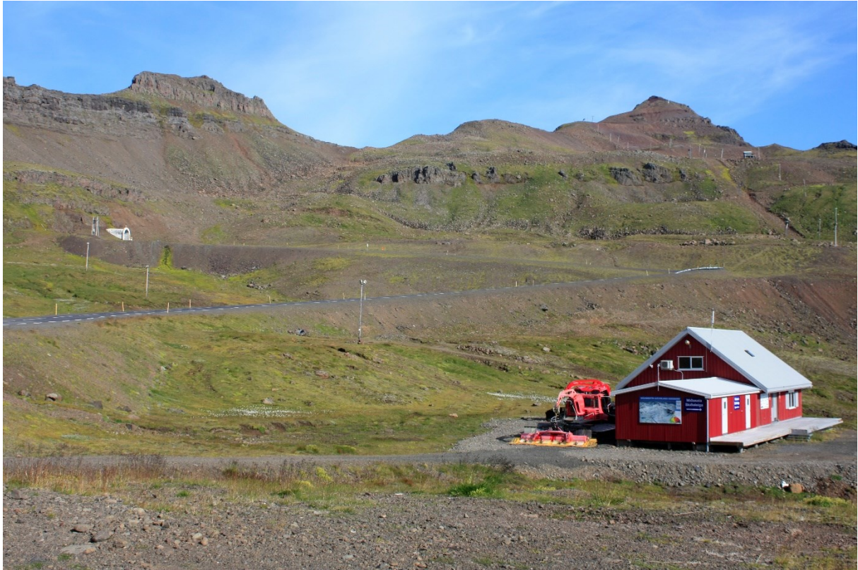
MYND 2.2 Útlit svæðisins að sumri til. Vegfyllingin sem verður fjarlægð sést fyrir miðri mynd og gangamunni Oddskarðsganga vinstra megin.

Skv. vistgerðarkorti Náttúrufræðistofnun Íslands er lyngmóavist(L10.8), mosamelavist(L1.3), urðarskriðuvist(L3.1), mosamóavist(10.1) og hraungambraivist(L5.3) algengustu vistgerðirnar á svæðinu.