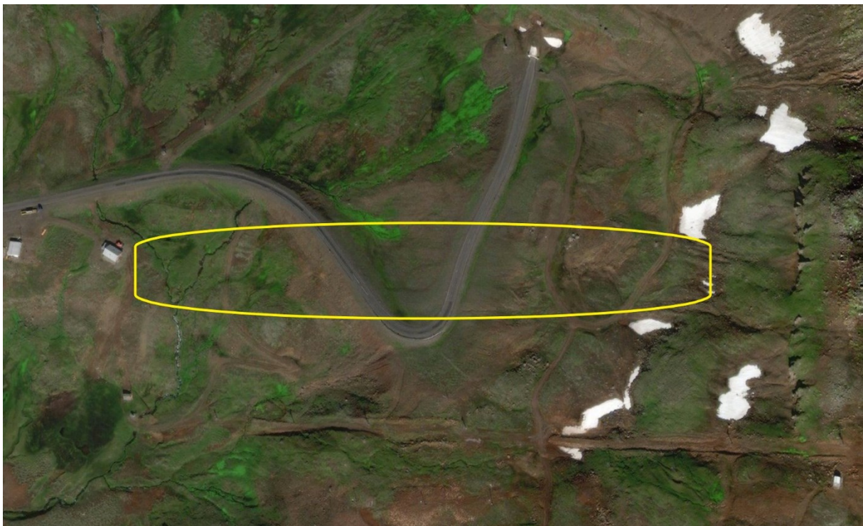
MYND 4.1 Gróflega áætlað framkvæmdasvæði nýrrar barnalyftu.

Ný staðsetning byrjendalyftu verður að stórum hluta innan gamla vegstæðis Oddskarðsvegar og þar fyrir ofan eru aðrir vegslóðar tengdir skíðasvæðinu. Framkvæmdasvæðið er því að stórum hluta raskað. Sá gróður sem finnst á svæðinu er fábrotinn og gróðurþekja slitrótt. Skv. vistgerðarkorti Náttúrufræðistofnun Íslands er lyngmóavist(L10.8), mosamelavist(L1.3), urðarskriðuvist(L3.1), mosamóavist(10.1) og hraungambravist(L5.3) algengustu vistgerðirnar á svæðinu. Lyngmóavist er með hátt verndargildi, urðarskriðuvist með miðlungs en hinar með lágt verndargildi [1].