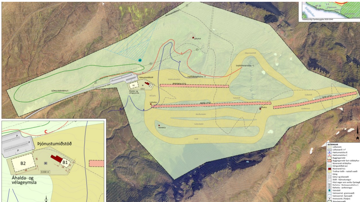
MYND 2.3 Nýr deiliskipulagsuppráttur skíðasvæðisins í Oddsskarði

Byrjendalyfta – gert er ráð fyrir að innan byggingarreits verði heimilt að reisa nýja diskalyftu ásamt því að reisa lítið hús fyrir stjórnbúnað lyftunnar að hámarki 20 m 2 . Gert er ráð fyrir að lyftan verði allt að 360 m að lengd og getur legið frá um 540 m.y.s. til 610 m.y.s. Jafnframt þarf að ráðast í landmótun meðfram lyftunni til að slétta svæðið og gera hæft til skíðaiðkunar.